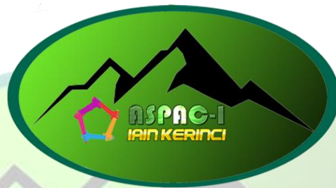
Gambar 1. Logo ASPAC-I

Logo Kegiatan Academic, Sport & Art Competitions of IAIN Kerinci ke I Tahun 2021 melambangkan Gunung Kerinci yang berlokasi di Kabupaten Kerinci Provinsi Jambi, melambangkan usaha/upaya generasi muda untuk meraih prestasi setinggi-tingginya.